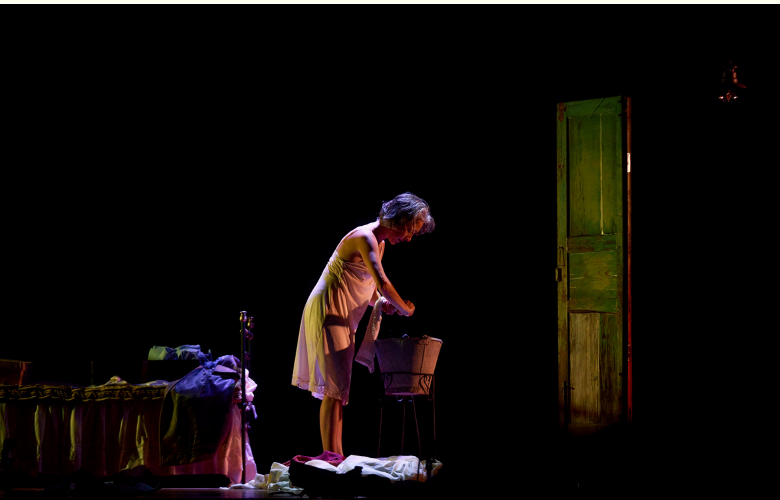
Imagen Ayto.de Arucas, 2024

PRODUCCIÓN GENERAL: Virginia Arencibia - Bilateral37